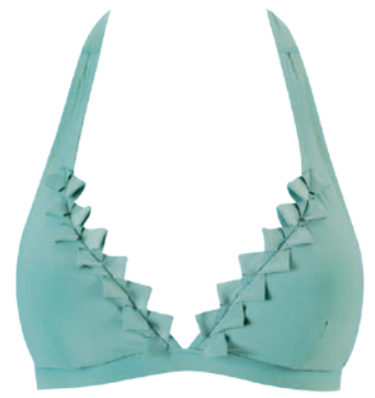
CALIDA Neckholder-Bikini mit verziertem Dekolleté, Top Fr. 69.90, Slip Fr. 59.90.