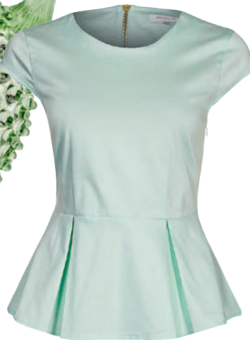
ZALANDO COLLECTION Top mit ausgestellttem Saum, bei zalando.ch , Fr. 48.–.