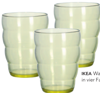
IKEA Wassergläser Skoja, in vier Farben, je Fr. 1.95.