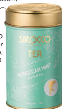
SIROCCO Marokkanischer Nana-Bio-Minzentee, 30g lose, Fr. 14.80.