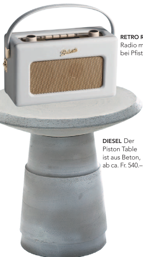
RETRO ROBERTS DAB-Radio mit iPod-Anschluss, bei Pfister, Fr. 299.-.