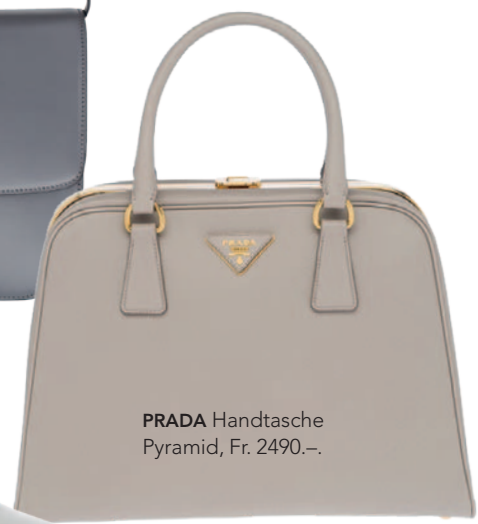
PRADA Handtasche Pyramid, Fr. 2490.-.