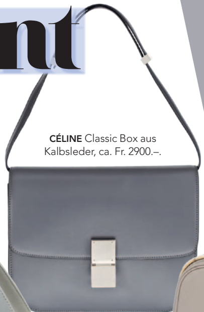
CÉLINE Classic Box aus Kalbsleder, ca. Fr. 2900.-.