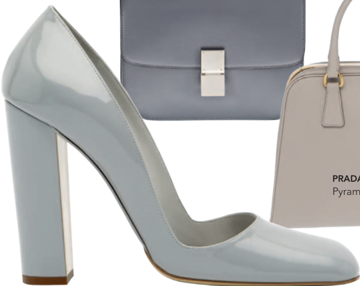
JIL SANDER Pumps aus Lackleder, ca. Fr. 420.-.