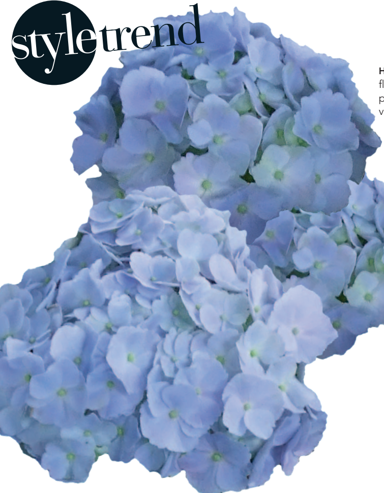
HORTENSIEN Lavendel- und fliederfarben, blau, weiss und pink: Die Ziersträucher blühen von Juni bis September.