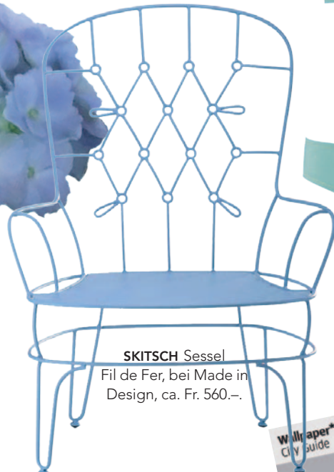
SKITSCH Sessel Fil de Fer, bei Made in Design, ca. Fr. 560.-.