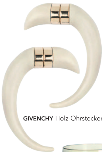
GIVENCHY Holz-Ohrstecker, ca. Fr. 500.–.