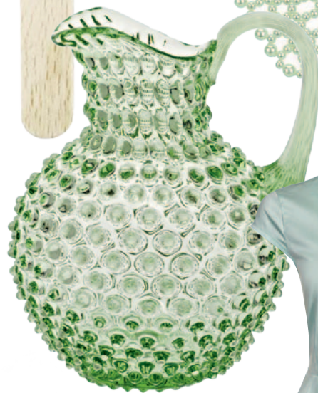
BELTRAME Krug Pointe de Diamant, Fr. 128.–.