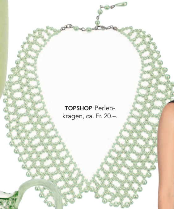
TOPSHOP Perlenkragen, ca. Fr. 20.–.