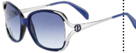
Träume in Himmelblau Sonnenbrille 775/S von Giorgio Armani . In vier Farben. Im Optikerfachgeschäft. ► CHF 375.-