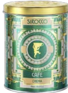
In Nostalgie gehüllt Premium-Kaffeemischung von Sirocco . 250-Gramm-Dose, ganze Bohnen oder gemahlen. www.sirocco.ch ► CHF 9.90