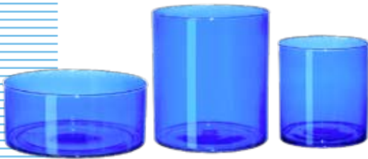
Blaue Stunden am Pool Vasen und Bowls aus blauem Glas. Dreier-Set von Ikea . Nur noch solange Vorrat. ► CHF 24.90