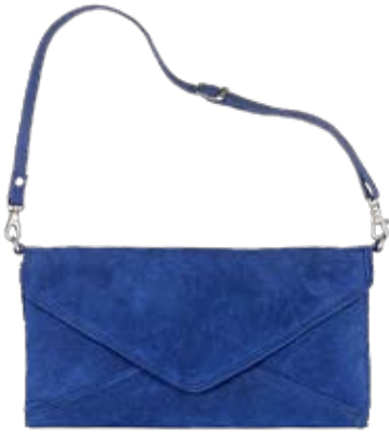
Schöner blauer Brief Wildleder-Clutch mit abnehmbarem Henkel. Von Impressionen . Über www.impressionen.ch ► CHF 169.-