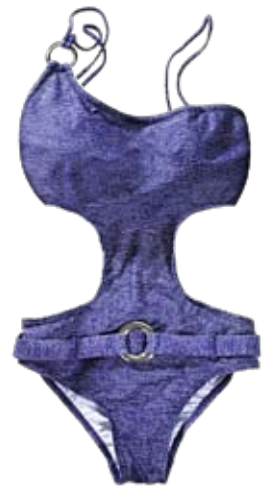
Göttin in Jeans Monokini in Jeans-Blau und mit Gürtel mit Silberschnalle. Yes or No , von Manor. Solange Vorrat. ► CHF 29.90