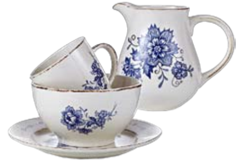
Unbeschwerter Sommermorgen Vierteiliges Frühstückssset von Impressionen . Über www.impressionen.ch ► CHF 39.95