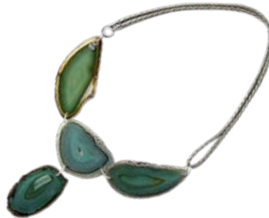
Das Meer überm Herzen Halskette mit Achat-scheiben, geflochtenem Lederband. Von Rockberries . www.rockberries.com ► CHF 380.-