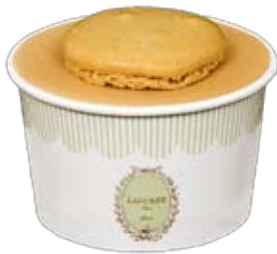
Eiskalte Macaronen-Kunst Glace von Ladurée , etwa in den Sorten Karamell, Erdbeere, Pistache, Vanille, Rosenblüten. Ladurée-Shop , Zürich. ► CHF 8.-